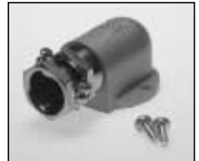
L4.73617.E Screw-type conduit fitting new from ser. no. 2482/ab Ser. Nr. 2482 Kabelverschraubung neu