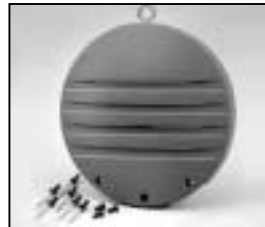
L4.73787.E to ser. no. 1758 / bis Ser. Nr. 1758 Rear casting / Rückteil