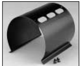
L4.73789.E to ser. no. 1758 / bis Ser. Nr. 1758 Internal side baffle/Mantelstromblech