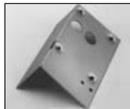
L4.73842.E Intermediate panel to ser. no. 733/94 Zwischenblech bis Ser. Nr. 733/94