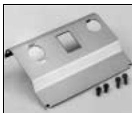
L4.73844.E Internal side baffle left to ser. no. 733/94 Mantelstromblech links bis Ser. Nr. 733/94