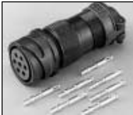
L4.71876.E Veam connector (female) Veam Stecker (Buchsenkontakt)