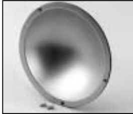
L4.79743.E Reflector Reflektor