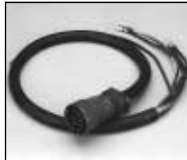
L4.76006.E Mains cable (Schaltbau) "German TV" with coupling ring Scheinwerferkabel (Schaltbau) "Deutsche Fernsehnorm" mit Überwurfmutter