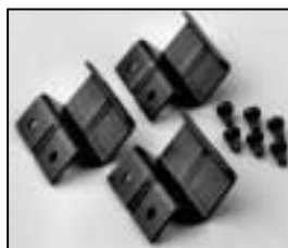
L4.79744.E Accessory bracket man. Halteklau man.