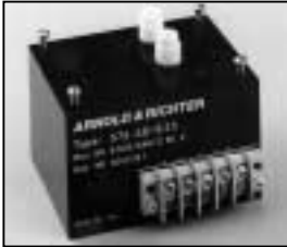
L4.73834.E Ignitor Zündgerät