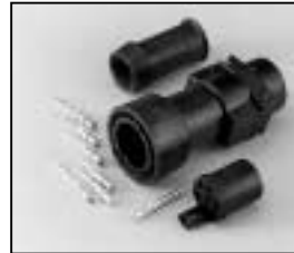
L4.75604.E Schaltbau connector (female) with coupling ring Schaltbau Stecker (Buchsenkontakt) mit Überwurfmutter