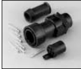
L4.75602.E Schaltbau connector (male) with coupling ring Schaltbau Stecker (Stiftkontakt) mit Überwurfmutter