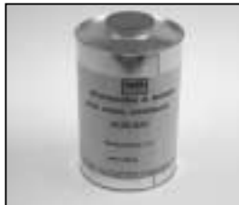
L4.70186.E Paint thinner Farb-Verdünnung