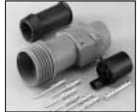
L4.75605.E Schaltbau connector (male) without coupling ring Schaltbau Stecker (Stiftkontakt) ohne Überwurfmutter