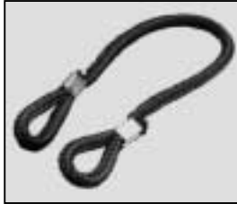
L4.79855.E Cable tie Halteleine