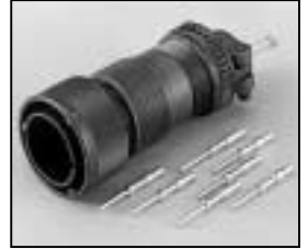
L4.71874.E Veam connector (male) Veam Stecker (Stiftkontakt)