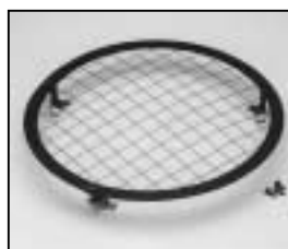
L4.79728.E Wire guard Schutzgitter