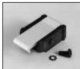
L4.79747.E Door catch set Schnapphaken-Set