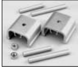
L4.74388.E from ser. no. 1759/ab Ser. Nr. 1759 Stirrup bracket Büggelager