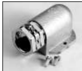
L4.73474.E Screw-type conduit fitting to ser. no. 2481/bis Ser. Nr. 2481 Kabelverschraubung