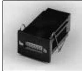
L4.77678.E Hour counter elec. 20/100 Hz from ser. no. 734/94 Betriebsstundenzähler elektr. 20/100 Hz ab Ser. Nr. 734/94