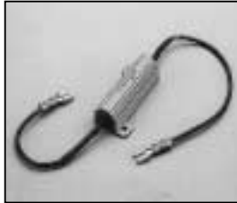
L4.73455.E Compensating resistance for electronic hour counter Vorwiderstand komplett für elektr. Betriebsstundenzähler