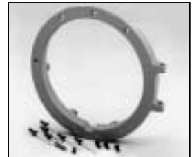
L4.73786.E to ser. no. 1758 / bis Ser. Nr. 1758 Front casting / Frontteil