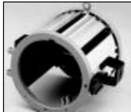
L4.79686.E from ser. no. 1759/ab Ser. Nr. 1759 Housing compl. / Gehäuse kpl.