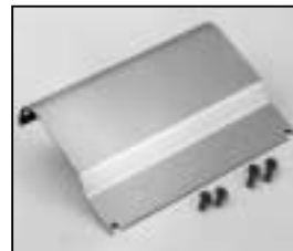
L4.73843.E Internal side baffle right to ser. no. 733/94 Mantelstromblech rechts bis Ser. Nr. 733/94