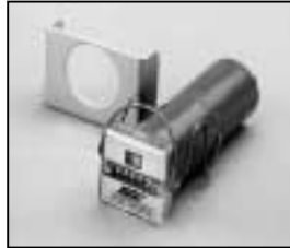
L4.73448.E Hour counter elec. 50/60 Hz to ser. no. 733/94 Betriebsstundenzähler elektr. 50/60 Hz bis Ser. Nr. 733/94