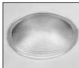
L4.79572.E Fresnel lens Stufenlinse