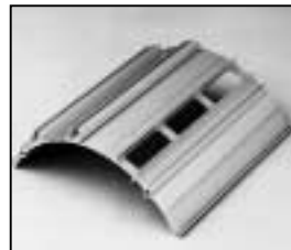
L4.79625.E from ser. no. 1759/ab Ser. Nr. 1759 Side extrusion compl./ri./le. / Rippenblech kpl./re./li.