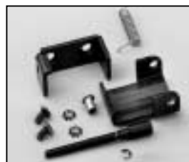
L4.73796.E Top latch man. Torsicherung man.