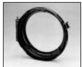
L4.79573.E Lens door Linsenfassung