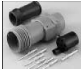
L4.75603.E Schaltbau connector (female) without coupling ring Schaltbau Stecker (Buchsenkontakt) ohne Überwurfmutter