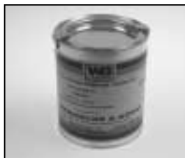
L4.70194.E Paint blue similar RAL 5015 Lack blau ähnlich RAL 5015