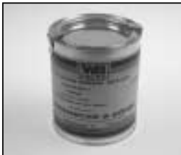
L4.70183.E Paint black similar RAL 9011 Lack schwarz ähnlich RAL 9011