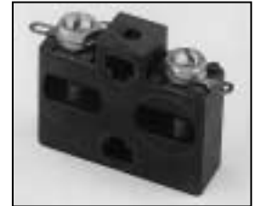
L4.75787.E Spark gap Funkenstrecke