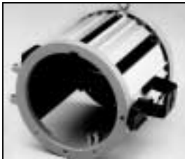
L4.73785.E to ser. no. 1758 / bis Ser. Nr. 1758 Housing compl. / Gehäuse kpl.

NOTE: WHEN ORDERING QUOTE PART NUMBER BEMERKUNG: BEI BESTELLUNG IDENT.-NR. ANGEBEN