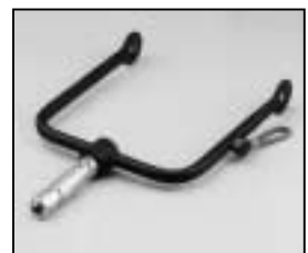
L4.73853.E Stirrup man. Haltebügel man.